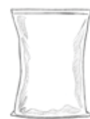
Kussentype (zonder zijvouwen)